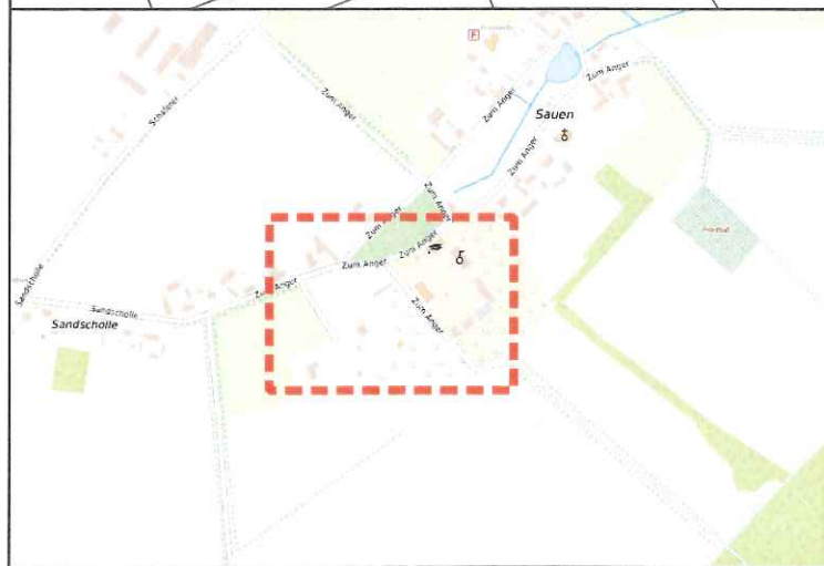
Übersichtskarte Maßstab 1:10.000

Im Satzungsgebiet sind für die Versiegelung von Boden folgende Kompensationsmaßnahmen durchzuführen: Für die Versiegelung von Flächen sind auf den nicht überbaubaren Grundstücksflächen flächige Pflanzungen mit heimischen und standortgerechten Laubgehölzen im Verhältnis 1:2 anzulegen und dauerhaft zu erhalten. Bis zu einem Anteil von 50% kann anstelle von flächigen Pflanzungen die Pflanzung heimischer Laubbäume und/oder hochstämmiger Obstbäume erfolgen. Dabei ist ein Hochstamm mit einem Stammumfang von mindestens 12-14cm je angefangene 50m 2 Vollversiegelungsfläche zu pflanzen. Für teilversiegelte Flächen kann der Umfang der Ersatzpflanzungen reduziert werden. Für die Ersatzpflanzungen ist bei der Pflanzenauswahl der Erlass für gebietsheimische Gehölze zu beachten.